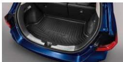
1. กระบะใส่ของท้ายรถ