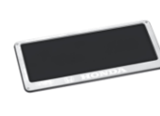
5. กรอบป้ายทะเบียนสเตนเลส