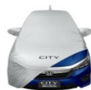
4. ผ้าคลุมรถ