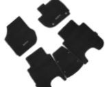
2. พรมปูพื้น